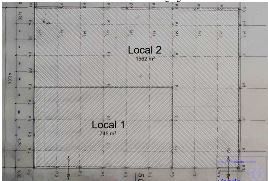
Plano Estado Segregado

La presente licencia se concede a salvo del derecho de propiedad y sin perjuicio de derechos de terceros, no suponiendo reconocimiento, ni fijación de linderos a salvo de los divisorios entre las locales resultantes tras la segregación.