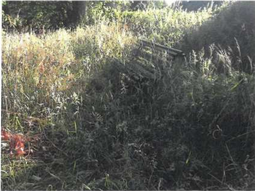
Parque de Bienvenido Rodríguez núm. 2 (7.2)

En este documento, de contener datos de carácter personal objeto de protección, éstos se encuentran omitidos o sustituidos por asteriscos (*) o por PARTICULAR, en cumplimiento de la Ley Orgánica 15/1999, de 13 de diciembre, de Protección de Datos de Carácter Personal