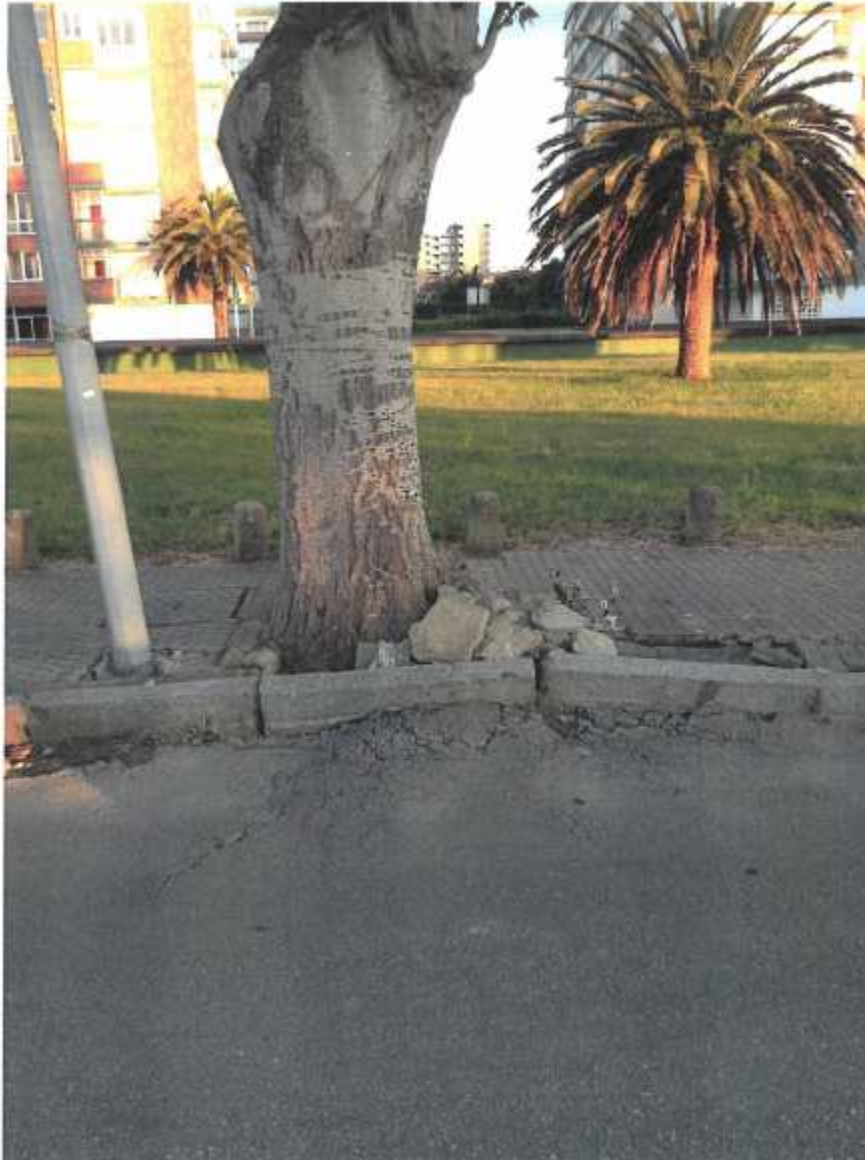
Alcorque vacío en la Calle Puerto Rico.

En este documento, de contener datos de carácter personal objeto de protección, éstos se encuentran omitidos o sustituidos por asteriscos (*) o por PARTICULAR, en cumplimiento de la Ley Orgánica 15/1999, de 13 de diciembre, de Protección de Datos de Carácter Personal