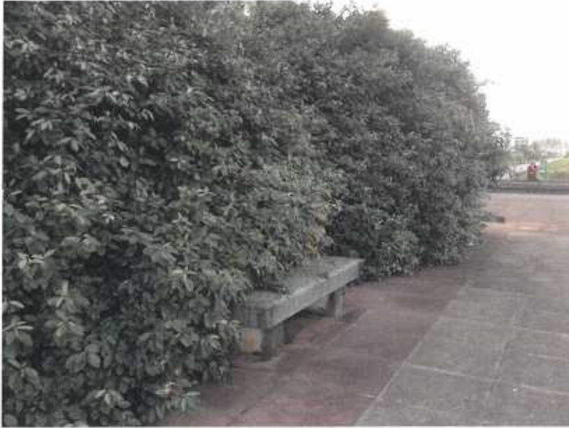
Mirador del paseo marítimo. Vegetación invadiendo el mirador. (2.3.2.4)