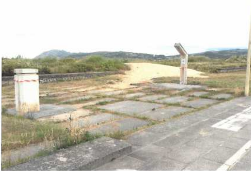
Arena invadiendo el paseo marítimo (2.1.4)