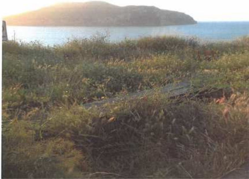
Atalaya. Fuerte del Rastrillar. Banco cubierto por la vegetación. (5.1)