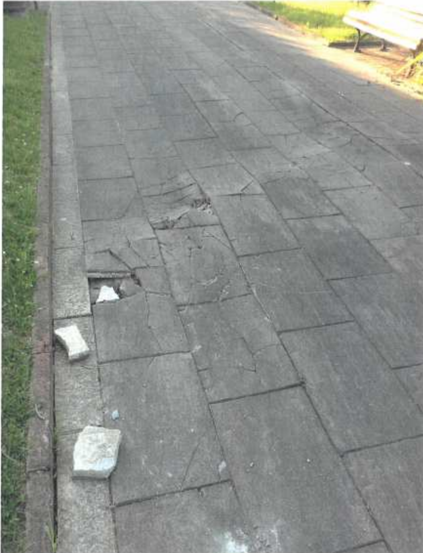
Paseo marítimo. A la altura de Ever. Pavimento Roto

En este documento, de contener datos de carácter personal objeto de protección, éstos se encuentran omitidos o sustituidos por asteriscos (*) o por PARTICULAR, en cumplimiento de la Ley Orgánica 15/1999, de 13 de diciembre, de Protección de Datos de Carácter Personal