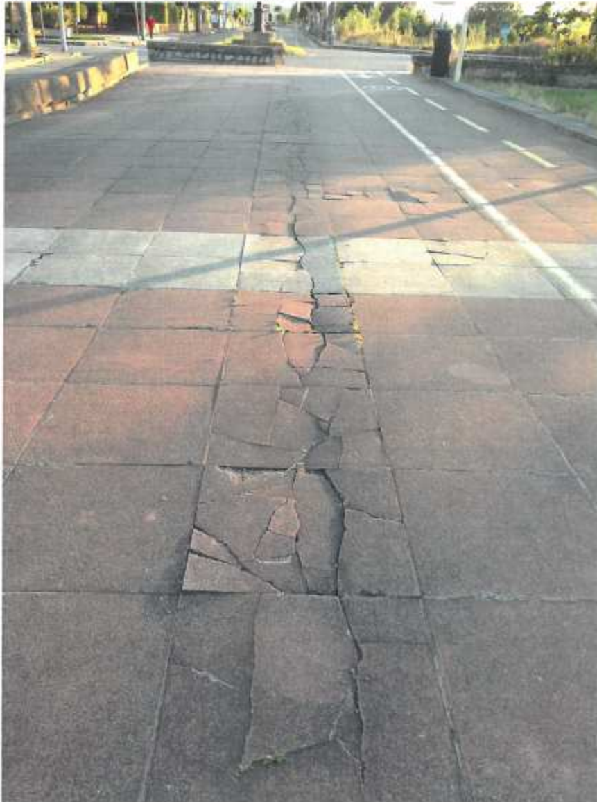
Pavimento roto en el paseo marítimo (2.3.1)

En este documento, de contener datos de carácter personal objeto de protección, éstos se encuentran omitidos o sustituidos por asteriscos (*) o por PARTICULAR, en cumplimiento de la Ley Orgánica 15/1999, de 13 de diciembre, de Protección de Datos de Carácter Personal