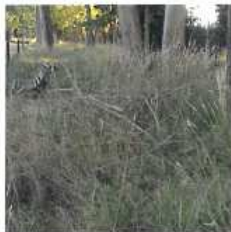
Calle Ignacio Ellacuría desbordándose a la acera y carretera. con la vegetación