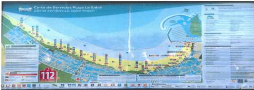
Mapa con num. de entrada y servicios

Piano informativo con la "Carta de Servicios Playa de Laredo" ubicado en el paseo marítimo a la altura de la C/ República de Colombia