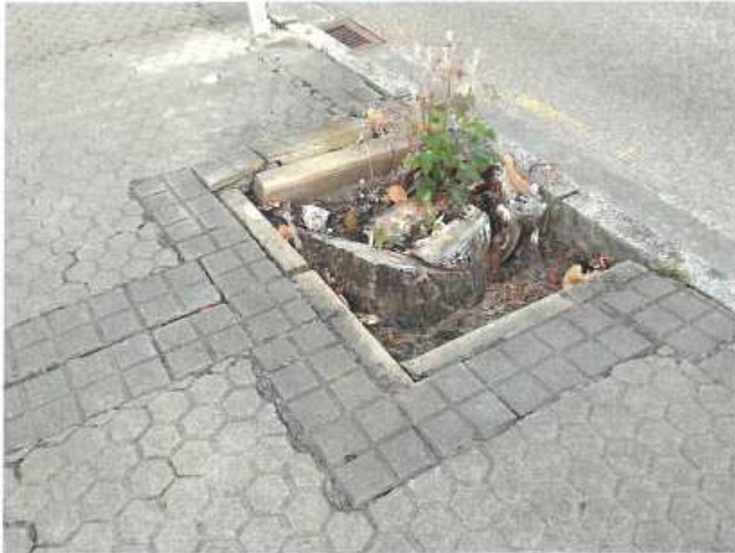
Calle Derechos Humanos Alcorque vacío.

En este documento, de contener datos de carácter personal objeto de protección, éstos se encuentran omitidos o sustituidos por asteriscos (*) o por PARTICULAR, en cumplimiento de la Ley Orgánica 15/1999, de 13 de diciembre, de Protección de Datos de Carácter Personal