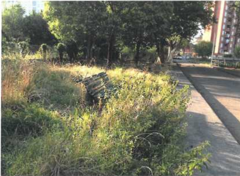
Parque Bienvenido Rodriguez num. 13 Banco cubierto por la vegetación (7.4)

En este documento, de contener datos de carácter personal objeto de protección, éstos se encuentran omitidos o sustituidos por asteriscos (*) o por PARTICULAR, en cumplimiento de la Ley Orgánica 15/1999, de 13 de diciembre, de Protección de Datos de Carácter Personal