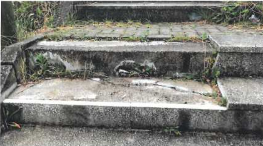
Escaleras de acceso a la atalaya invadido por la vegetación (3.4)