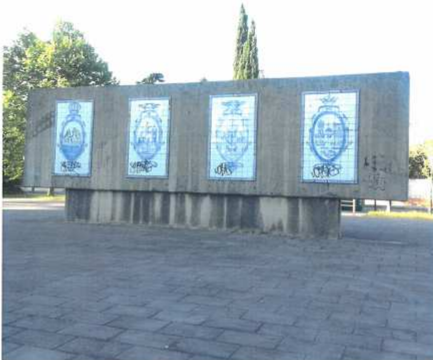
Parque de los 3 Laredos, mural que ha sufrido el vandalismo. (8.7)

En este documento, de contener datos de carácter personal objeto de protección, éstos se encuentran omitidos o sustituidos por asteriscos (*) o por PARTICULAR, en cumplimiento de la Ley Orgánica 15/1999, de 13 de diciembre, de Protección de Datos de Carácter Personal