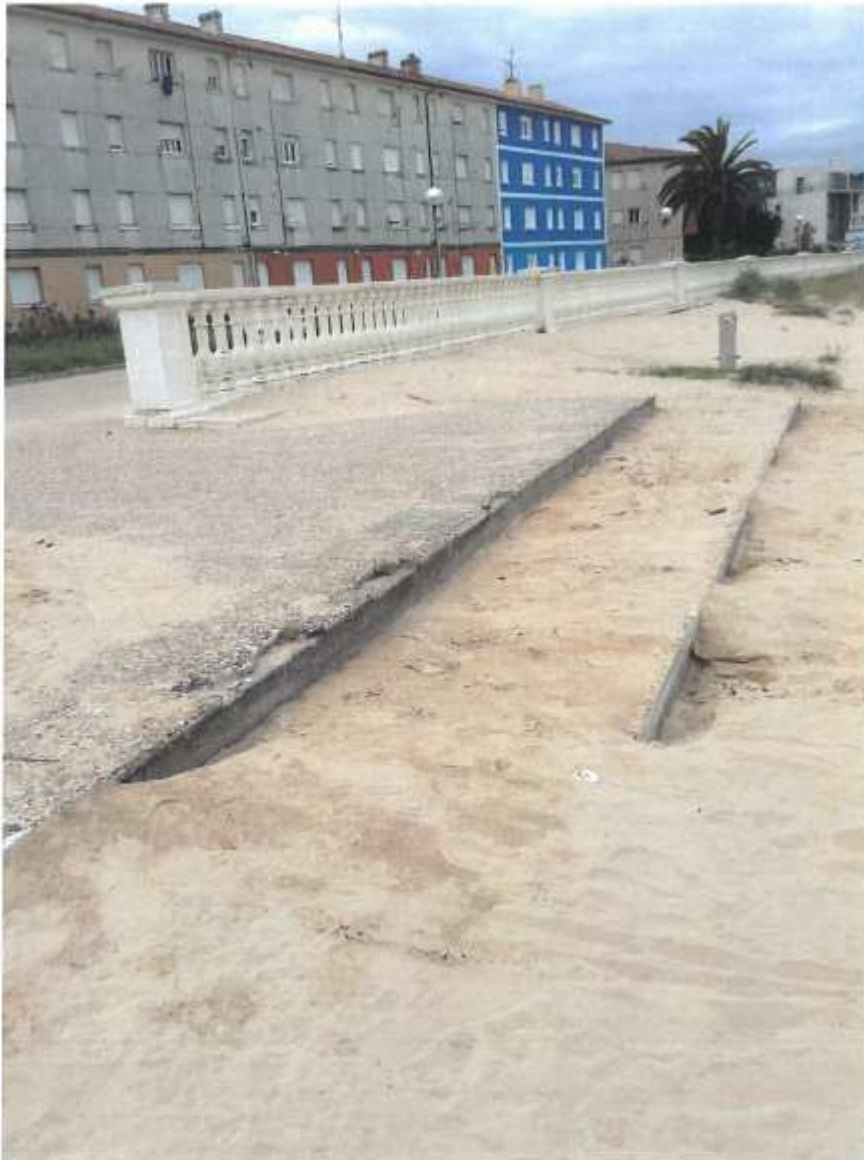
Acceso a la playa anegado de arena (1.3)

En este documento, de contener datos de carácter personal objeto de protección, éstos se encuentran omitidos o sustituidos por asteriscos (*) o por PARTICULAR, en cumplimiento de la Ley Orgánica 15/1999, de 13 de diciembre, de Protección de Datos de Carácter Personal