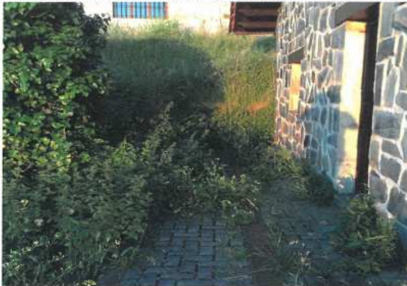
Fuerte del Rastrillar. Mirador del Canto invadido por la vegetación (5.3)