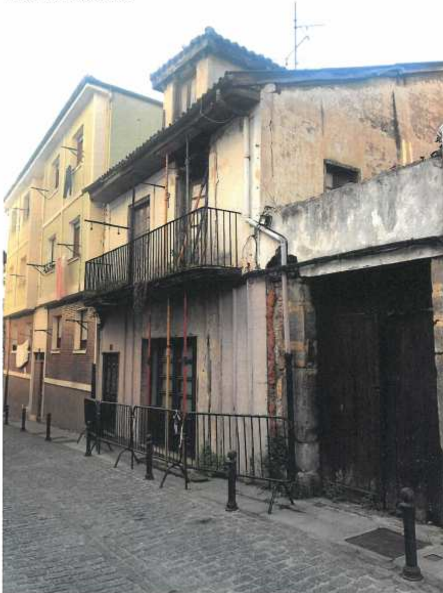
Puebla vieja. Estado actual

En este documento, de contener datos de carácter personal objeto de protección, éstos se encuentran omitidos o sustituidos por asteriscos (*) o por PARTICULAR, en cumplimiento de la Ley Orgánica 15/1999, de 13 de diciembre, de Protección de Datos de Carácter Personal