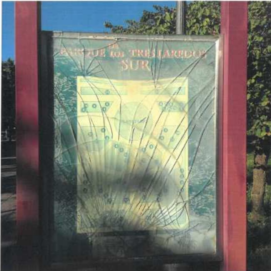
Parque de los tres Laredos. Cabeza de lámparas corroidas y vacías (8.9)

En este documento, de contener datos de carácter personal objeto de protección, éstos se encuentran omitidos o sustituidos por asteriscos (*) o por PARTICULAR, en cumplimiento de la Ley Orgánica 15/1999, de 13 de diciembre, de Protección de Datos de Carácter Personal