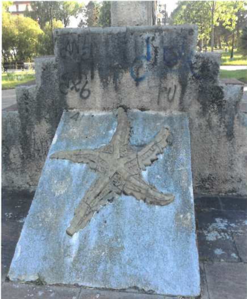
Parque de los tres Laredos. Monumento deteriorado y con acto de vandalismo (8.13)

En este documento, de contener datos de carácter personal objeto de protección, éstos se encuentran omitidos o sustituidos por asteriscos (*) o por PARTICULAR, en cumplimiento de la Ley Orgánica 15/1999, de 13 de diciembre, de Protección de Datos de Carácter Personal