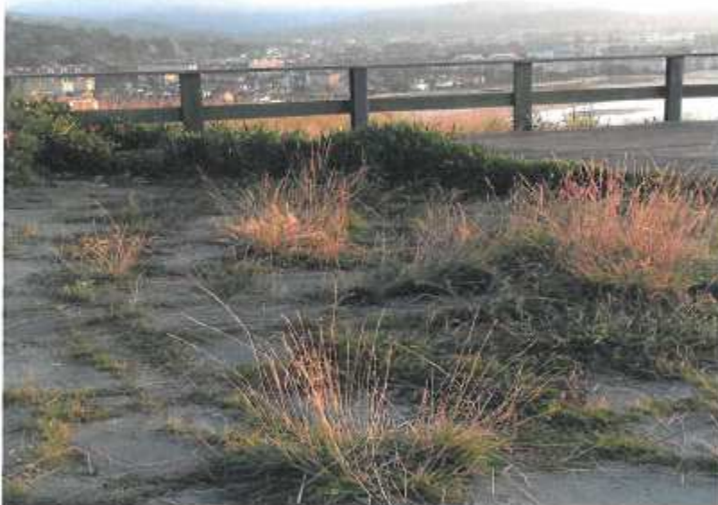
Mirador de la Atalaya. Banco cubierto por la vegetación (4.2)