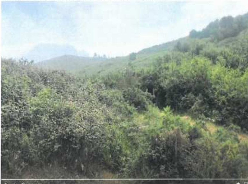
Parque de Bienvenido Rodríguez núm. 2. Banco cubierto por la vegetación. (7.1)