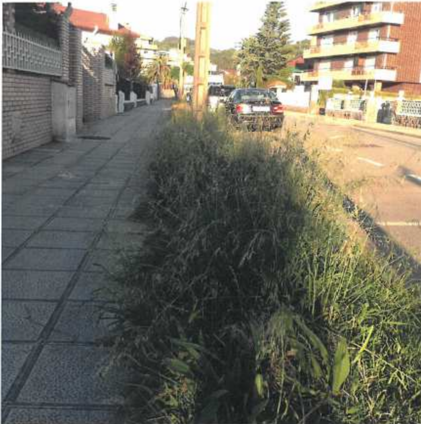
C/ Padre Ignacio Ellacuría

En este documento, de contener datos de carácter personal objeto de protección, éstos se encuentran omitidos o sustituidos por asteriscos (*) o por PARTICULAR, en cumplimiento de la Ley Orgánica 15/1999, de 13 de diciembre, de Protección de Datos de Carácter Personal