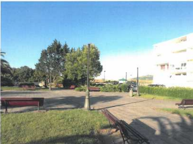
Parque Público. Lampara sin cabeza (8.5)