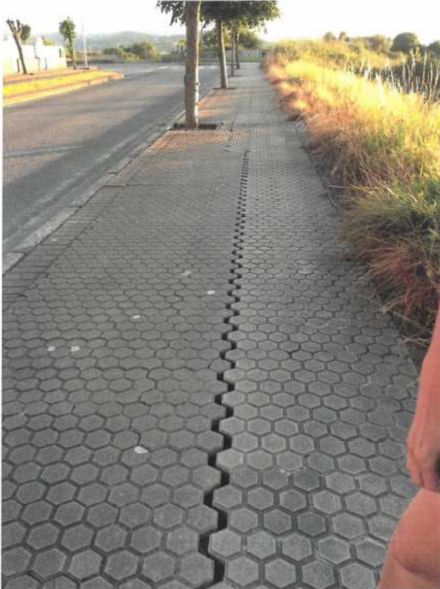
Acera rota. Av. República Puerto Rico.

En este documento, de contener datos de carácter personal objeto de protección, éstos se encuentran omitidos o sustituidos por asteriscos (*) o por PARTICULAR, en cumplimiento de la Ley Orgánica 15/1999, de 13 de diciembre, de Protección de Datos de Carácter Personal