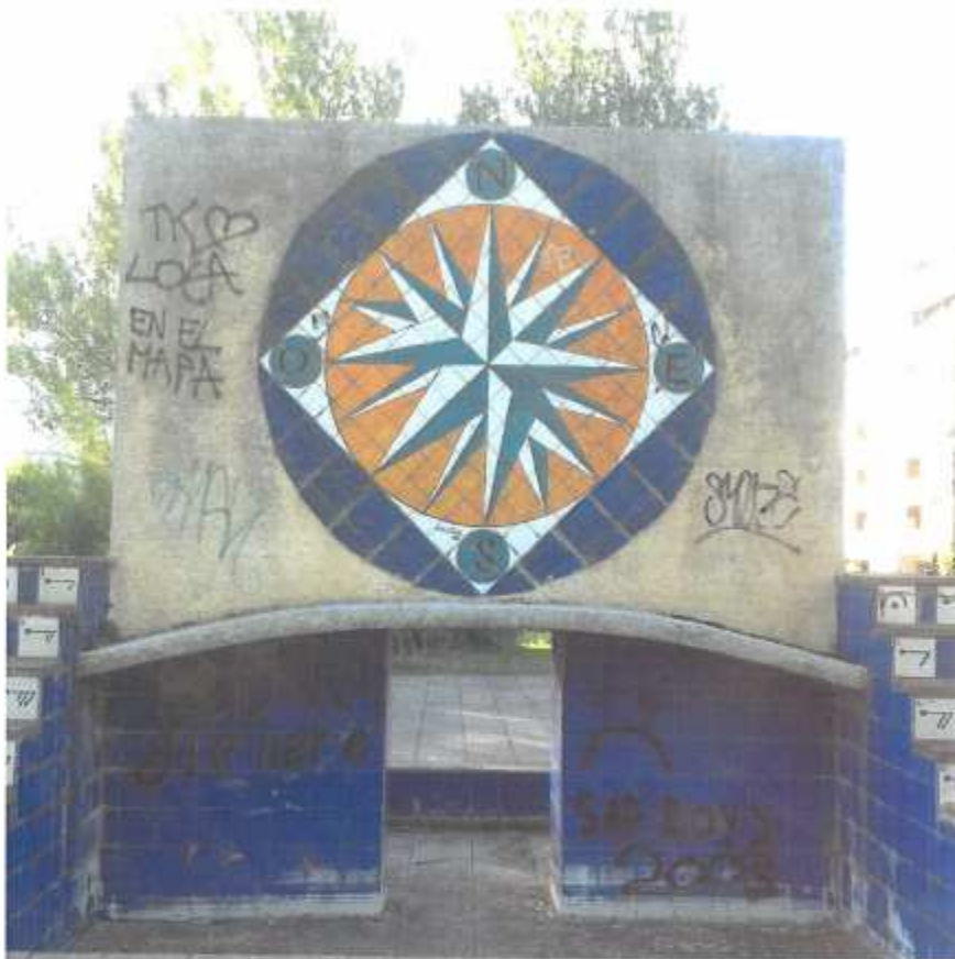
Parque de los tres Laredos. Monumento que ha sufrido el vandalismo (8.11)

En este documento, de contener datos de carácter personal objeto de protección, éstos se encuentran omitidos o sustituidos por asteriscos (*) o por PARTICULAR, en cumplimiento de la Ley Orgánica 15/1999, de 13 de diciembre, de Protección de Datos de Carácter Personal