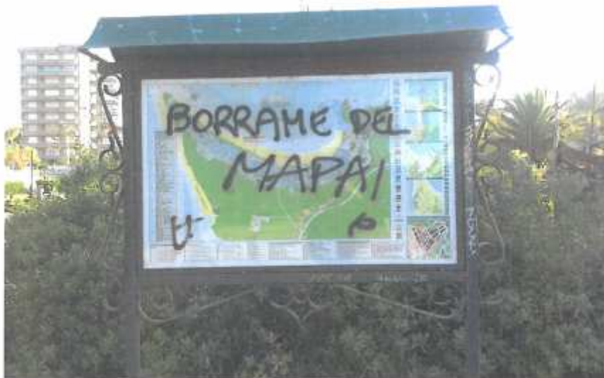
Carteles Pintados en el paseo marítimo (2.3.2.2)