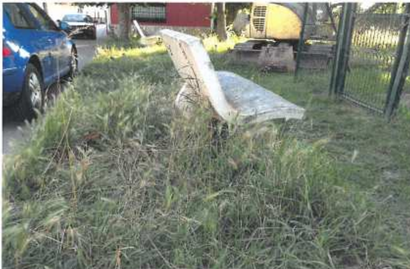
Parque Bienvenido Rodríguez núm 13 Banco Cubierto por la vegetación (.7.3)