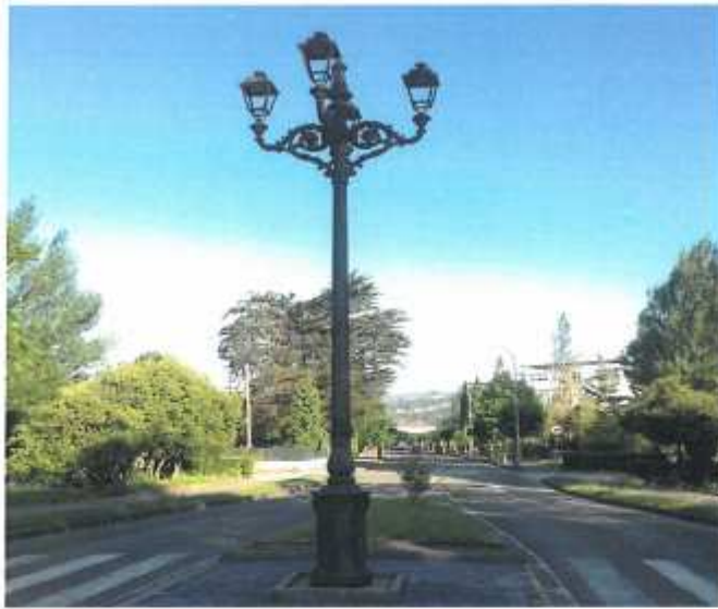
Parque de los tres Laredos, Farola sin bombillas. (8.2)

En este documento, de contener datos de carácter personal objeto de protección, éstos se encuentran omitidos o sustituidos por asteriscos (*) o por PARTICULAR, en cumplimiento de la Ley Orgánica 15/1999, de 13 de diciembre, de Protección de Datos de Carácter Personal