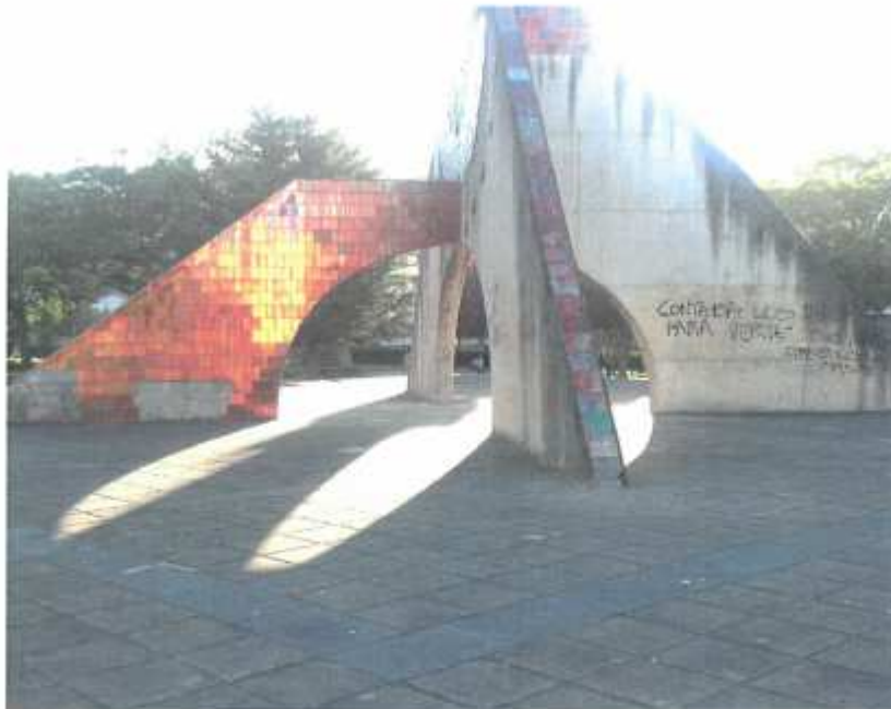
Parque de los tres Laredos. Monumento deteriorado (8.14)

En este documento, de contener datos de carácter personal objeto de protección, éstos se encuentran omitidos o sustituidos por asteriscos (*) o por PARTICULAR, en cumplimiento de la Ley Orgánica 15/1999, de 13 de diciembre, de Protección de Datos de Carácter Personal