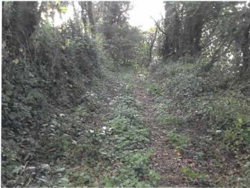
Rutas del encanto, invadida por la vegetación. Playa de San Julián (6.2)

En este documento, de contener datos de carácter personal objeto de protección, éstos se encuentran omitidos o sustituidos por asteriscos (*) o por PARTICULAR, en cumplimiento de la Ley Orgánica 15/1999, de 13 de diciembre, de Protección de Datos de Carácter Personal