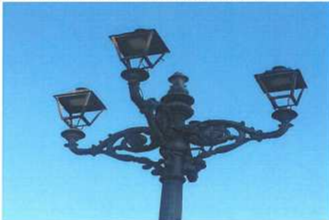
Parque de los tres Laredos. Farolas sin cabeza (8.3)