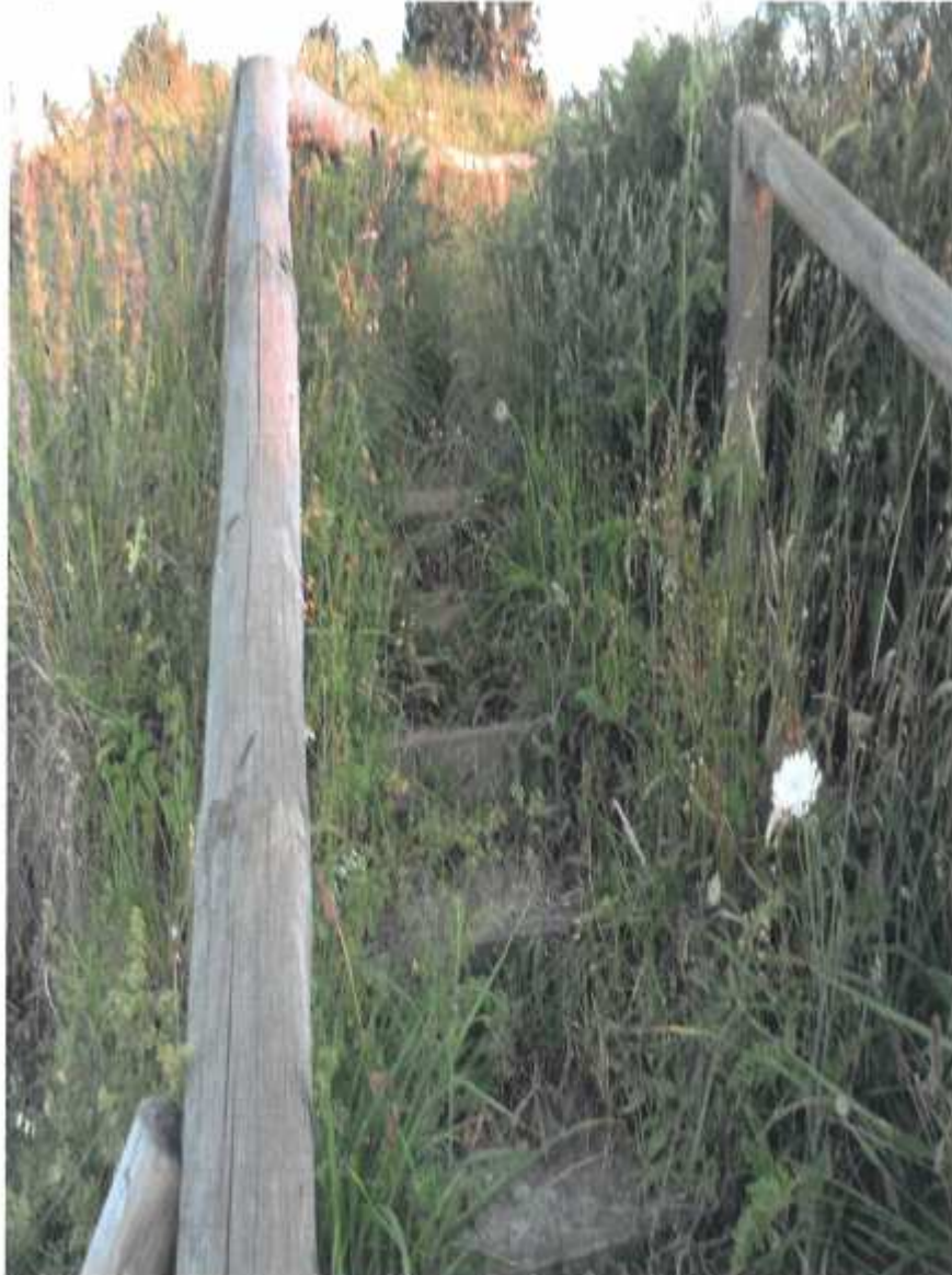
Ruta con encanto invadida por la vegetación (Pico del Hacha) (6.1)