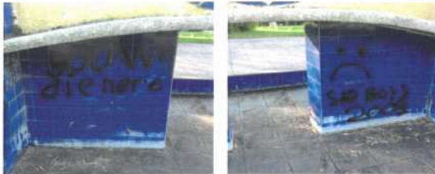
Parque de los tres Laredos. Monumento que ha sufrido el vandalismo (8.12)