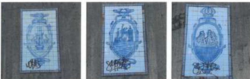
Parque de los tres Laredos. Cartel informativo gravemente deteriorado (8.8)