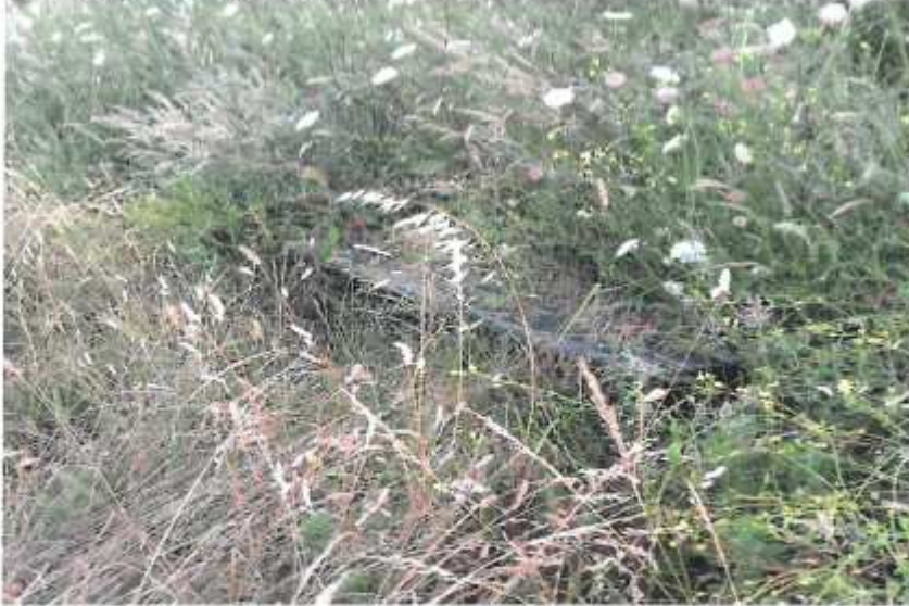
Atalaya. Fuerte del Rastrillar. Mirador del Canto invadido por la vegetación. (5.5)