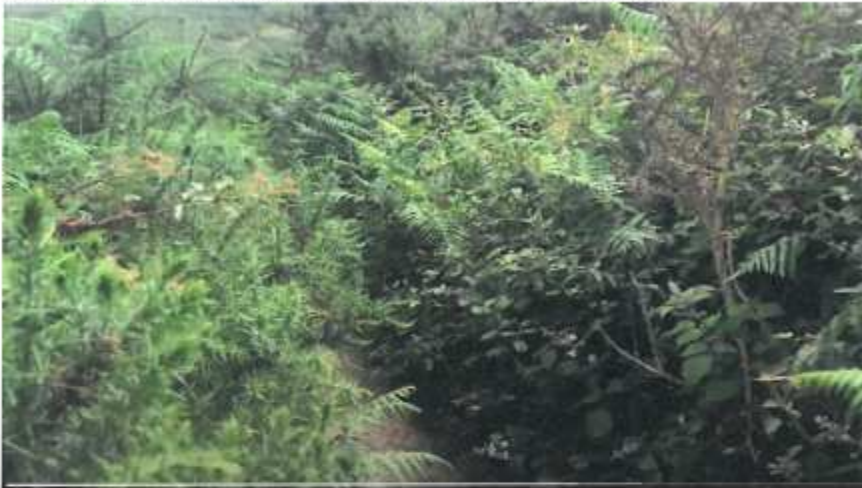
Ruta con encanto. Invasión por la vegetación. Valverde (6.4)