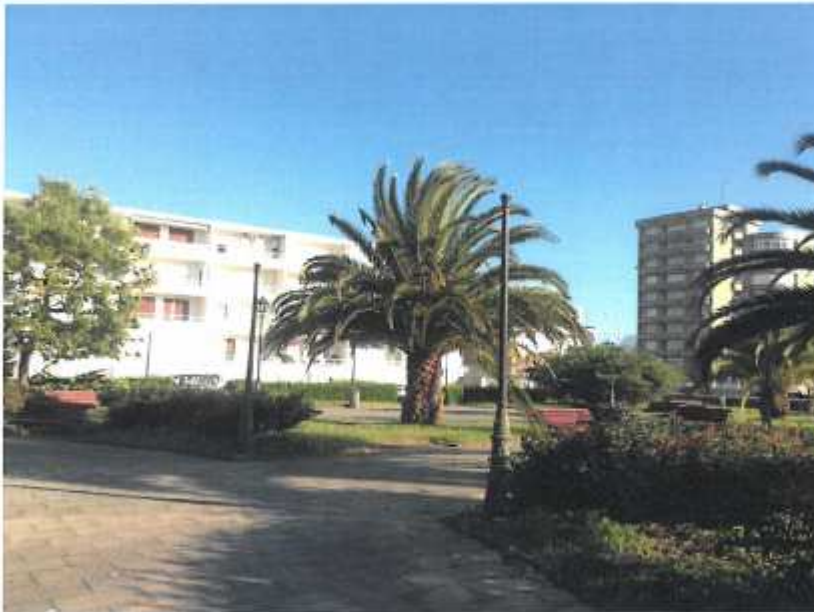
Parque Público Farola sin cabeza (8.4)

En este documento, de contener datos de carácter personal objeto de protección, éstos se encuentran omitidos o sustituidos por asteriscos (*) o por PARTICULAR, en cumplimiento de la Ley Orgánica 15/1999, de 13 de diciembre, de Protección de Datos de Carácter Personal